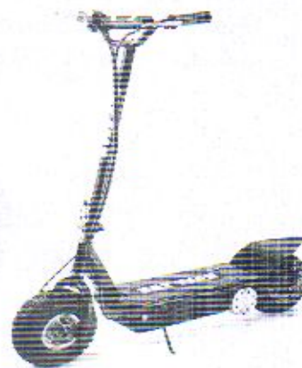
*Фотографијата е од информативен карактер