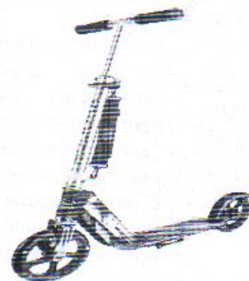
*Фотографијата е од информативен карактер

5. Согласно Коментарските забелешки на Хармонизиран систем (ХС) во тарифниот број 9503 се опфатени тротинети на две тркала наменети да се возат од деца, како и од млади и возрасни, а движењето се врши без вграден електричен мотор, односно со сопствена снага на корисникот со оттурнување со ногата од тлото. Овој тип на тротинет согласно Царинската тарифа се распоредува во тарифна ознака 9503 00 10 00.